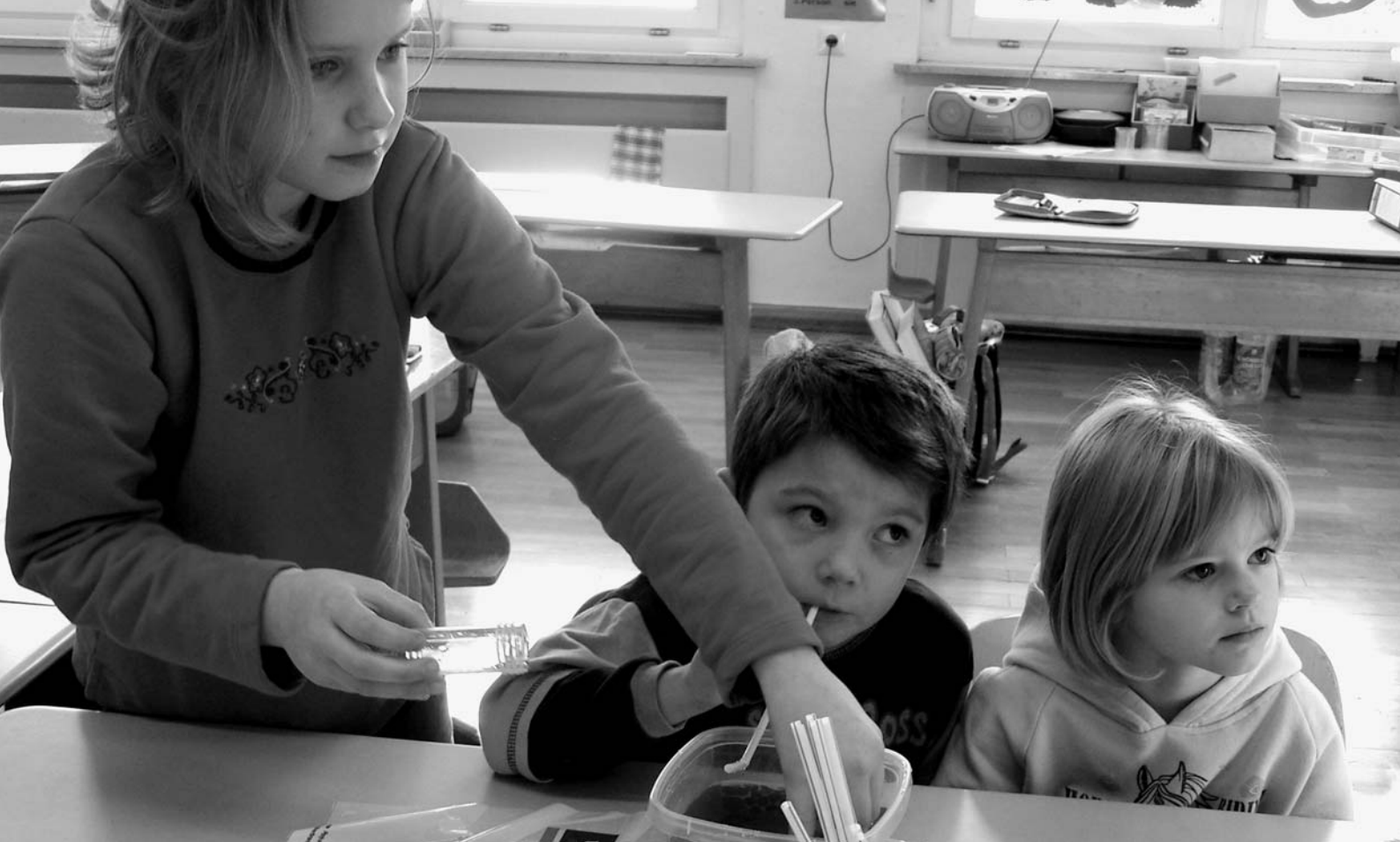
„Bildungshaus“ in der Praxis: An der Uhlandschule in Metzingen-Neuhausen erklären Viertklässler Kindergartenkindern Experimente zum Thema „Luft“.