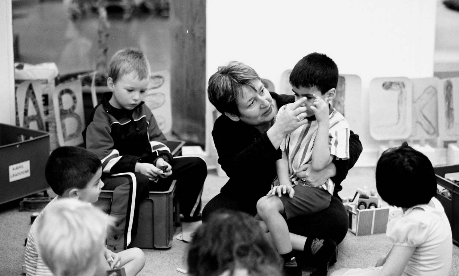
Bei der Vielzahl der Kinder und den schlechten Rahmenbedingungen fällt es schwer, die für jedes Kind individuell notwendigen pädagogischen Schritte konsequent umzusetzen.