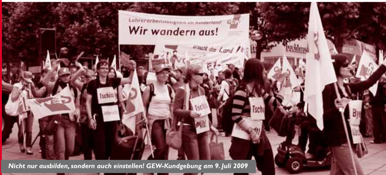
Nicht nur ausbilden, sondern auch einstellen! GEW-Kundgebung am 9. Juli 2009

Dafür stehen die GEW-Mitglieder im Hauptpersonalrat gemeinsam mit den Personalräten der Schulverwaltung und der Seminare: