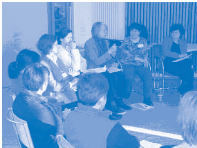
Aus der frauenpolitischen Arbeit der GEW: Frauenvertreterinnen werden kompetent von der GEW beraten. Workshopphase beim Frauenkongress „Bildung ist weiblich?“ am 14./15.01.2005 in Esslingen

Bei der abschließenden Probezeitbeurteilung kann sich die Schulaufsicht im Einzelfall die Bildung des maßgeblichen Gesamturteils vorbehalten. Nur hier erfolgt noch eine zweistufige Beurteilung. Es muss dafür jedoch ein besonderes dienstliches Bedürfnis bestehen.