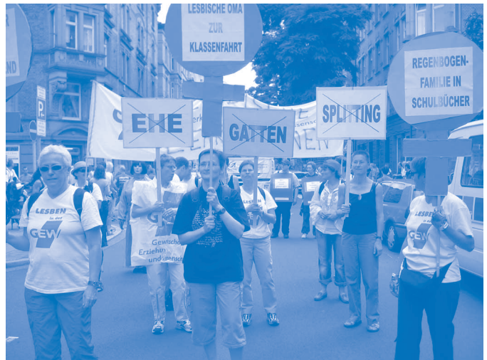
Frauen der AK Lesbenpolitik machen die GEW sichtbar: Teilnahme an der Christopher Street Day Parade 2005 unter dem Motto „Familie“