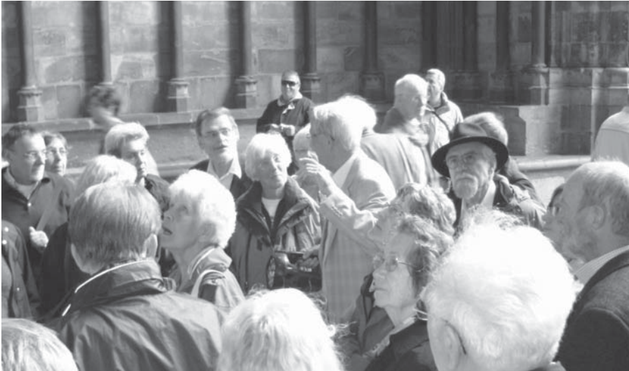
Über die Drei-Länder-Fahrt der Rubeständler/innen aus dem Rhein-Neckar-Kreis berichten wir auf Seite 7.

Herausgegeben vom Fachbereich Seniorenpolitik der Gewerkschaft Erziehung und Wissenschaft (GEW) Landesverband Baden-Württemberg