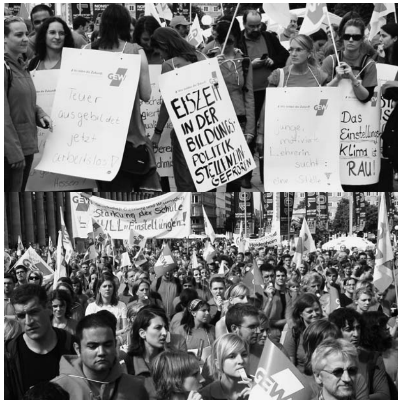
3.000 junge, gut ausgebildete Lehrer/innen kämpfen vor der Sommerpause in Stuttgart für ihre Einstellung in den Schuldienst.