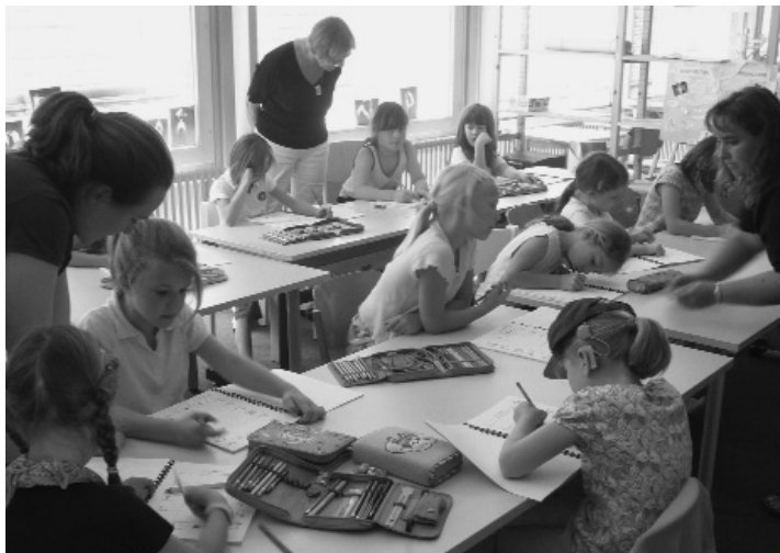
Schule ohne Noten! Lernprozesse werden reflektiert und in Lerntagebüchern und Portfoliomappen dokumentiert.

klebt ihr persönlicher Wochenplan. An unterschiedlichen Stellen des Raumes machen sie sich an die Arbeit. Sie werden heute durch fünf Erwachsene unterstützt: zwei Lehrkräfte und zwei Praktikantinnen, die immer da sind und eine Sonderpädagogin, die nur mittwochs im Haus ist. Da am Wochenende die Präsentation des Afrika-Projekts ansteht, arbeiten einige Kinder noch an restlichen Aufgaben in ihrem Afrikabuch, andere