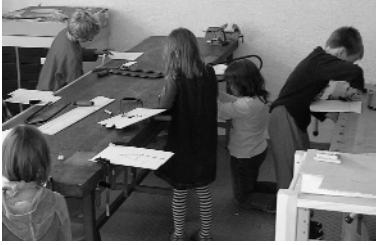
Profis ergänzen das Lehrerinnenteam. In der Holzwerkstatt arbeitet eine Schreinermeisterin. Englisch unterrichtet ein Muttersprachler.