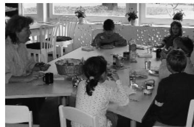
Gebundener Ganzttag mit gemeinsamen Frühstück und Mittagessen und rhythmisierten Lernzeiten an Vor- und Nachmittag.

Nach dem Sprachspiel ist „Denkpause“ angesagt. Die Kinder teilen sich in zwei Gruppen, holen ihr Lernbegleitheft und denken darüber nach, was sie heute gelernt ha-