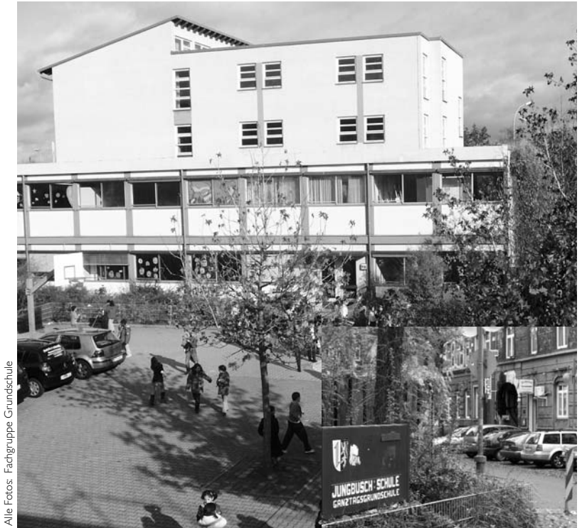
Der Schulneubau der Ganztagsgrundschule im alten Innenstadtteil Jungbusch in Mannheim.

Der Schule kommt dabei eine Schlüsselfunktion zu und sie versteht sich ganz bewusst als Schule im Stadtteil. Über vielfältige Angebote und eine aktive Elternarbeit stellt sie sich den Herausforderungen der Schulentwicklung als Teil der Stadtteilentwicklung. Neuester Treffpunkt ist die erst vor kurzem eingeweihte Schulturnhalle, die über den Sport hinaus als Begegnungsstätte für Familien, Vereine und alle Einwohner dient. Als