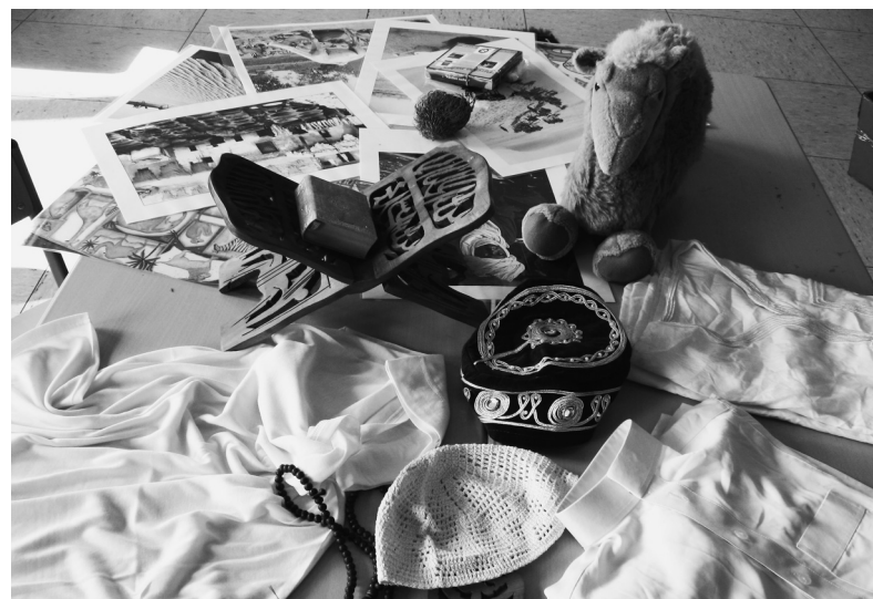
Anschauungsmaterial für den Islamunterricht