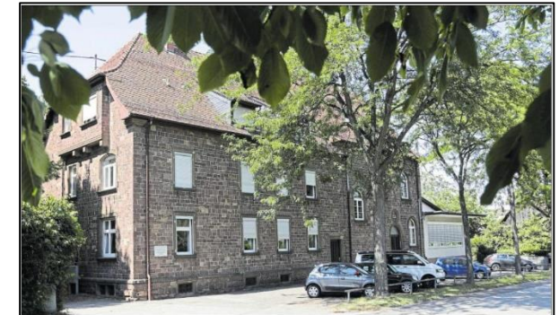
DIE GRUNDSCHULE in Wolfartsweier hat das erste Jahr mit Ganztagsbetrieb hinter sich. Die beengte Raumsituation beschäftigte jazz auch die Gewerkschaft Erziehung und Wissenschaft (GEW).