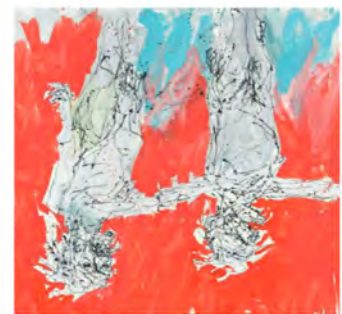
Georg Baselitz - O strass endet - 2013