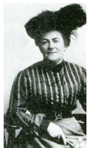
Clara Zetkin, ca. 1890

Die Sozialistin Clara Zetkin , eine Pionierin der proletarischen Frauenbewegung, lebte und wirkte von 1891 bis 1925 in Stuttgart. Wir folgen den Spuren ihres Lebens in dieser Stadt. Von der Rotebühlstraße über die Furtbachstraße, dem Sitz des Dietz Verlages, zur Blumenstraße (mit VVS) führt der Weg in die Kirchheimer Straße in Sillenbuch (mit VVS) zu ihrem ehemaligen Wohnhaus.