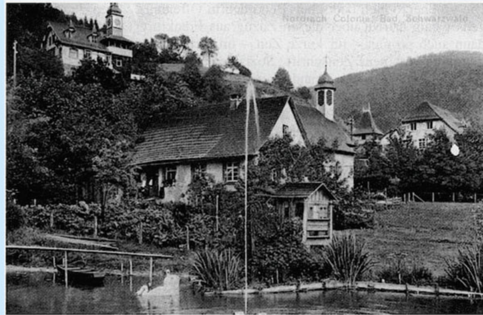
Dr. Walther'sches Paradies