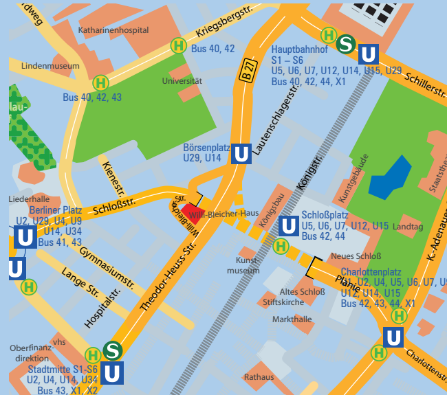
V. i. S. d. P.: DGB-Region Nordwürttemberg, Willi-Bleicher-Str. 20, 70174 Stuttgart Gestaltung: Jörg Munder

Finissage: Donnerstag, 17.10. 2019, 18:00 Uhr