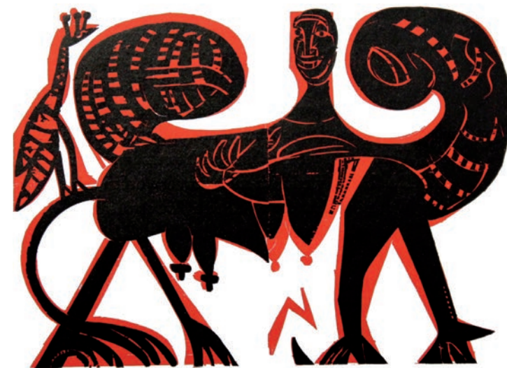
Machu Picchu, 1965, © VG Bild-Kunst, Bonn 2019

Donnerstag, 17. Oktober 2019, 18:00 Uhr Der politische Grieshaber – Dokumente und Geschichten aus dem Nachlass von HAP Grieshaber