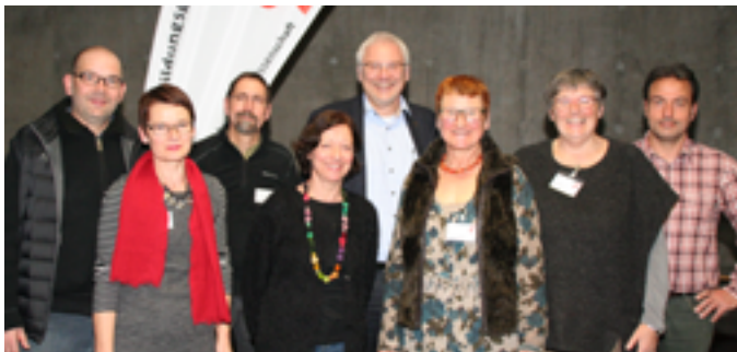
Fachgruppe Gewerbliche, Haus- und Landwirtschaftliche, Sozialpädagogische und Pflegerische Schulen

Die GEW unterstützt Mitglieder, die Personalratsmitglieder, Beauftragte für Chancengleichheit oder Schwerbehindertenvertretungen sind, mit Beratung und Schulungen. Die GEW ist mit Abstand die größte Interessenvertretung im Bildungsbereich und hat in Baden-Württemberg 50.000 Mitglieder.